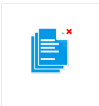
Рис.4. Отметка о загруженном файле.

При наличии вопросов просим Вас писать на e-mail hsct.plan@fnkc.ru .